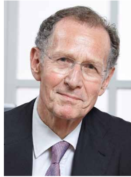
Prof. Dr. Dr.h.c. Bert Rürup